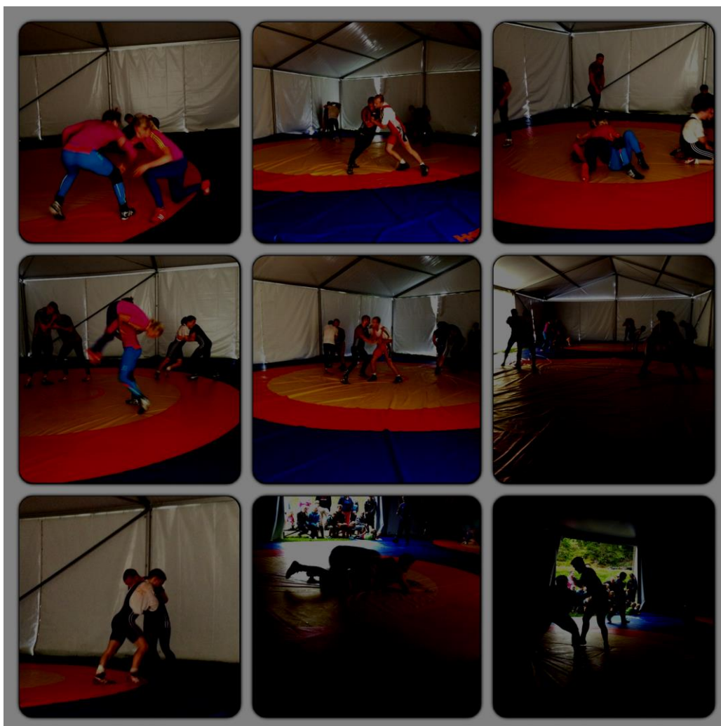
Axplock utav träningen